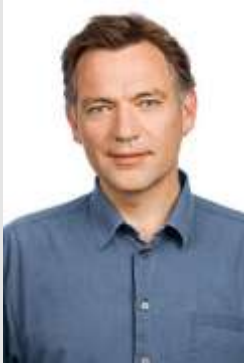
Jan Van Aken

Jan Van Aken war von 1997 bis 1998 Gentechnik-Campaigner bei Greenpeace, Deutschland. Von 2003 bis 2004 war er Leiter der Forschungsstelle Biowaffen an der Uni Hamburg. Jan Van Aken ist Mitglied des Bundestages (Die Linke) und im Auswärtigen Ausschuss und Unterausschuss Abrüstung tätig.