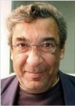
Mandooh Habashi (Mamdouh Habashi)

Mandooh Habashi ist Vizepräsident des Weltforums für Alternativen und im Vorstand des Arabisch-Afrikanischen Forschungszentrums, Kairo.